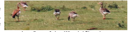
Junggänse auf einer Wiese bei Ringenberg, links eine Nielgans, rechts Graugänse

Mit etwas Glück kann man Störche, Reiher und Kiebitze beobachten, an der Blänke vielleicht auch einmal Uferschnepfen, und auf den Blüten Schmetterlinge. Kiebitze und Uferschnepfen leiden als Bodenbrüter besonders unter der frühen Mahd der Wiesen. Im Winter landet schon mal ein Schwarm Wildgänse zum Äsen auf einer der Weiden. Der Niederrhein dient vielen Wildgänsen als Winterquartier. Einige Gänse bleiben aber auch im Sommer, besonders die ursprünglich aus Tiergärten entflohenen exotischeren Arten.