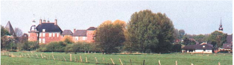
Blick von Osten auf Ringenberg, links die kath. Kirche, das Schloss, rechts die ev. Kirche

An der Kreuzung hinter dem Sportplatz kann man den Weg ein Stück nach rechts gehen und hat von dort einen sehr schönen Blick auf Ringenberg und das Schloss.